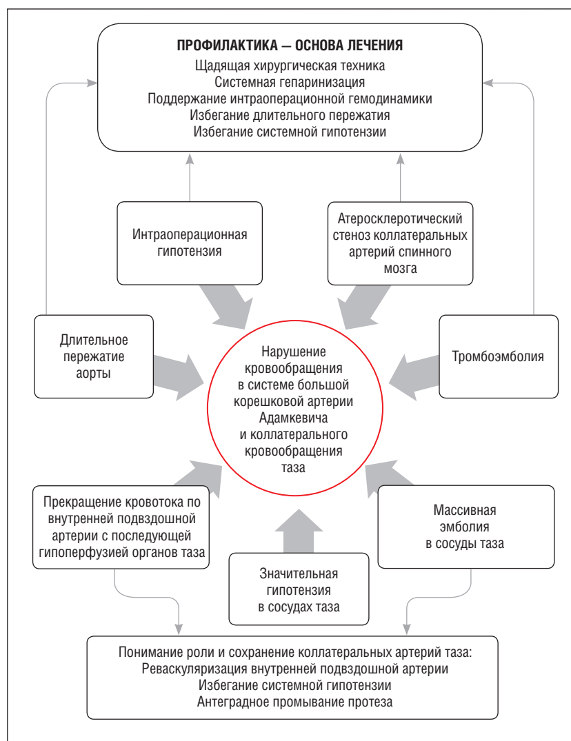
Рис. 2. Схема механизмов развития и способов профилактики ишемического повреждения спинного мозга.

вается «анастомотическая петля конуса» (Lazorthes G. и соавт.) [8].